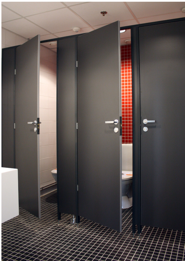
LTT 24 skærmvægge.