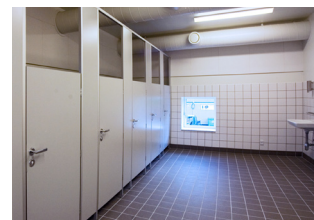
LTT skærmvægge i børnehaver.