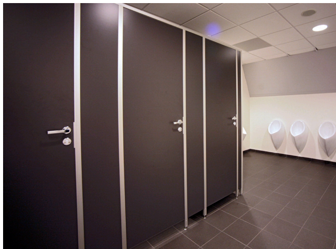
LTT 24 skærmvægge. Jyske Bank "Boxen", Multiarena i Herning.