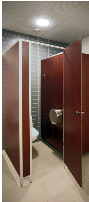
LTT 13 skærmvægge.

Falkesen ApS er en dansk ejet handelsvirksomhed der er grundlagt i 2005 med adresse i Holbæk. Falkesen ApS distribuerer byggematerialer og andre relaterede produkter til byggebranchen.