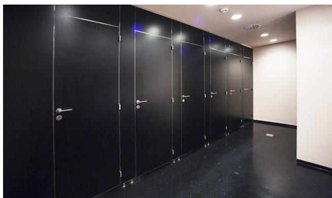
INOX 32 skærmvægge. Kulturcenter Svendborg.