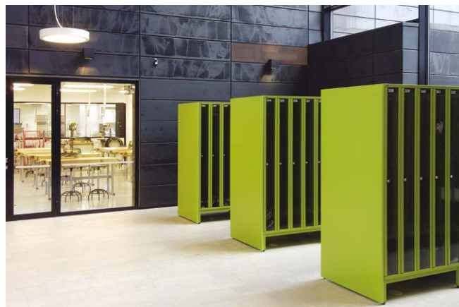
PUNTA VKP lockers til offentlige steder.

Falkesen ApS leverer desuden skillevægssystemer, skærmvægge, toilet- og brusevægge og relaterede produkter til byggebranchen.