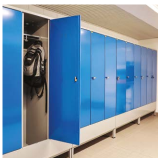
PUNTA VKL lockers til forening.