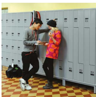
PUNTA VKZ og LK4 til uddannelse.