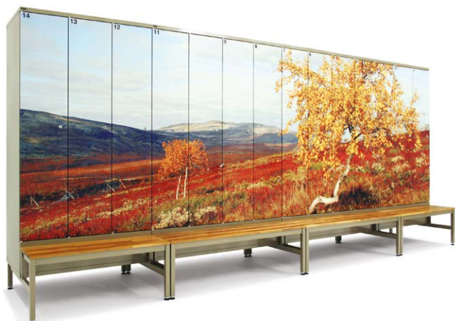
PUNTA Art-Evo VKL lockers med bænk.