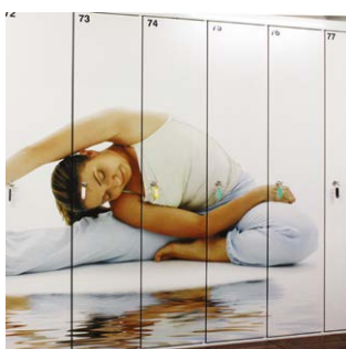
PUNTA Art-Evo, VKL lockers.